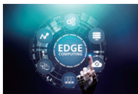
エッジAI・組み込みAI