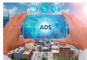
デジタルマーケティング